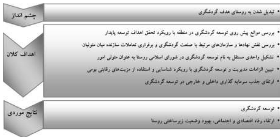
شکل شماره ۲: الگوی توسعه گردشگری روستای بیشه دراز دهلران

آورد؛ در ادامه، طرح عملی ترسیم گردد یعنی ابزاری که به وسیله‌ی آنها بتوان اهداف مشخص شده را بدست آورد. اشکال شماره ۲ و ۳ الگوی توسعه گردشگری روستای بیشه دراز و ماتریس راهبردها و برنامه‌های اجرایی به منظور تسریع در روند دستیابی به هدف مورد نظر این مقاله را نشان می‌دهند.